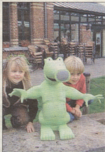
Anty zal kinderen begeleiden in het ziekenhuis.

Anty wordt een knuffelrobot die essentiële bewegingen zal kunnen maken waarbij het zekere menselijke emoties zal herkennen en op zich ook beantwoorden. Via een tele-interface in de buik van de robot wordt Anty tevens een kindvriendelijke computerinterface die ook gerichte internetapplicaties zal aanbieden. Het belangrijkste element van de robot is het hoofd. Hierin zullen ogen met sluitende oogleden, een be-