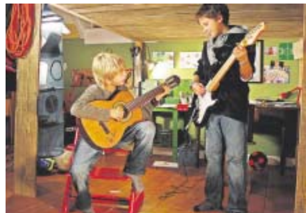
Kinder und Jugendliche, die von Musik begeistert sind, können beim Wettbewerb „Dein Song“ mitmachen.

Bewerben könnt ihr euch noch bis zum 30. März 2008 auf www.deinsong.kika.de .