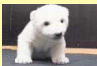
Flocke ist im Fernsehen.

Im Zoo Berlin wohnt nicht nur Eisbär Knut, auch Tiger Darius, Flusspferd Gregor und Gorilla Ivo sind hier zu Hause. Die Zoogeschichten „Panda, Gorilla & Co“ erzählen täglich von den verschiedensten Tieren. Die Tierpfleger wissen ganz besonders viel über ihre Schützlinge. Wer Eisbärin Flocke mag,