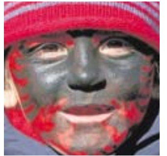
Dieser Junge aus Pristina hat sich die Kosovo-Flagge mit dem schwarzen Adler aufs Gesicht gemalt.